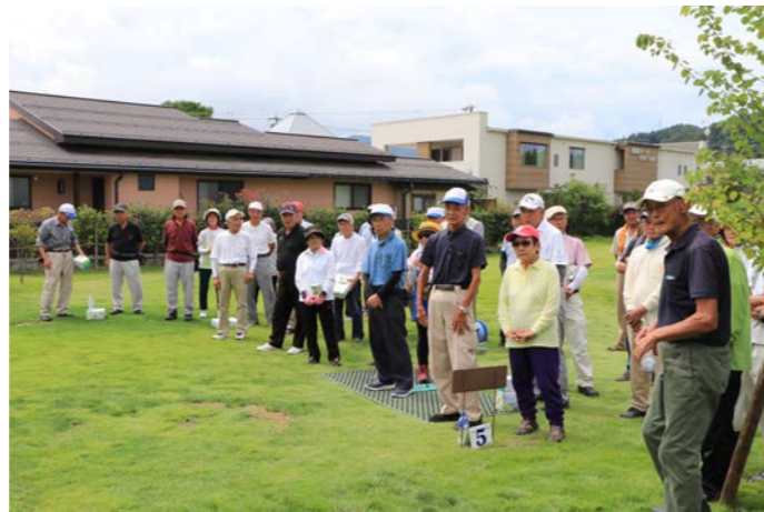
▲大勢の皆様にご参加いただきました。