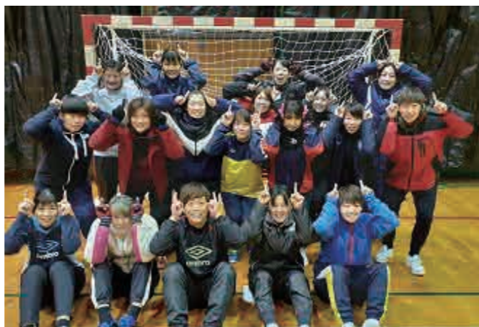
今年は丑年！ブルズの年！（撮影時のみマスクを外しました。）

現在9試合を終えて、0勝9敗の9チーム中9位。苦しい状況が続いていますが、1勝目をあげるためにチーム一丸となって頑張ります。応援していただいている方々に、結果で恩返しができるように引き続き試合に臨んでいきます。ブラックブルズに熱い声援をよろしくお願いいたします！