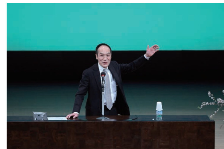
▲講師 東国原 英夫 氏

令和4年3月23日（水）、高山市民文化会館大ホールにて第114回ひだしん会が行われました。 今回は講師に、東国原 英夫さんをお招きし、「ピンチをチャンスに！」と題して講演をいただきました。 お笑い芸人、小説家、知事、国会議員などキャリアを積んでいく過程をユーモアたっぷりにお話 しいただき、あっという間の90分でした。